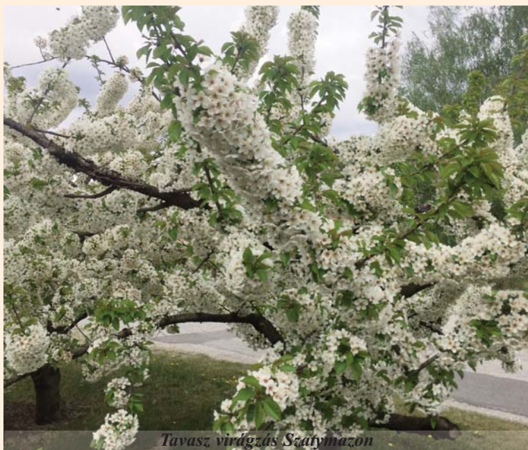
Tavaszi virágzás Szatymazon