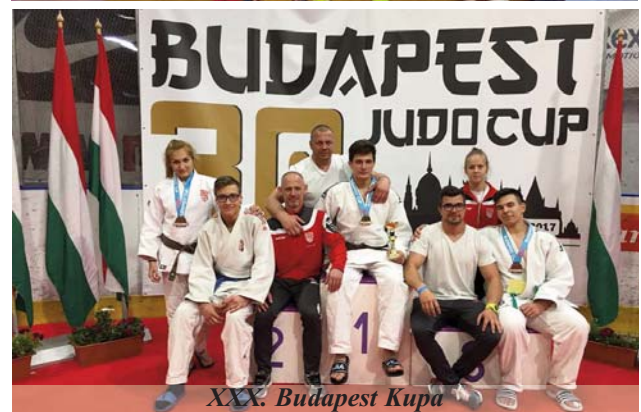
XXX. Budapest Kupa