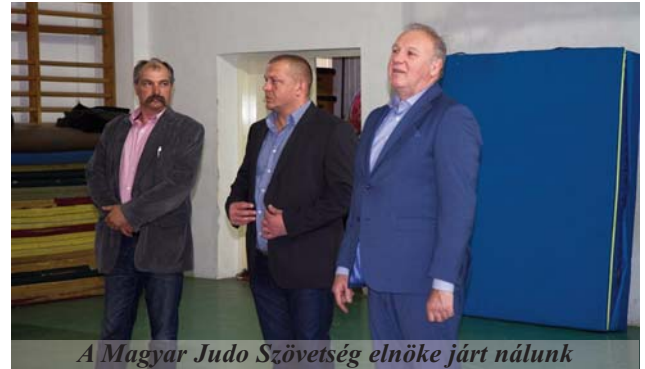
A Magyar Judo Szövetség elnöke járt nálunk