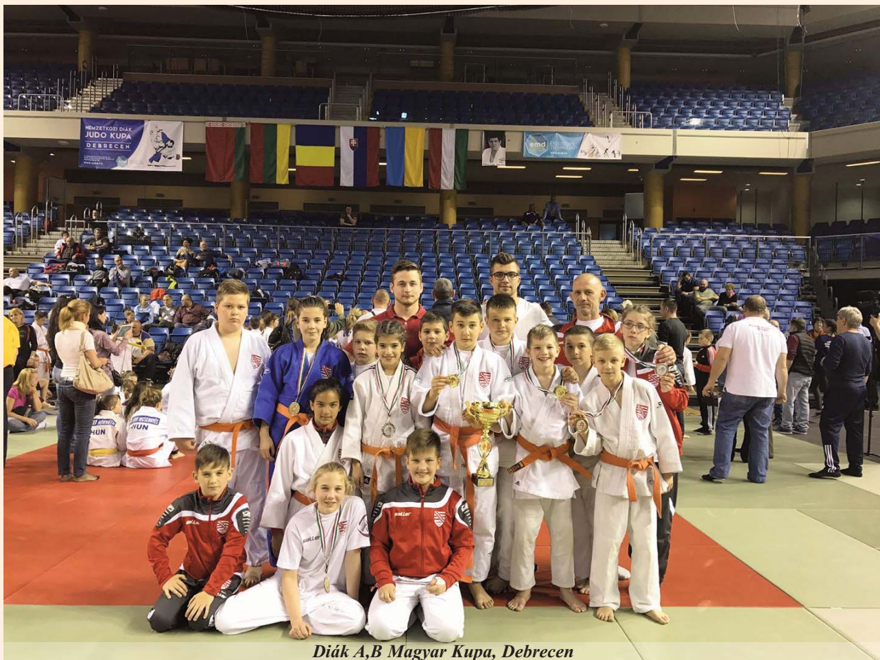
Diák A,B Magyar Kupa, Debrecen