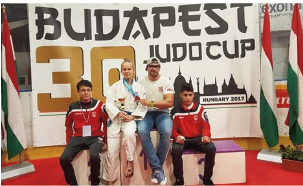
XXX. Budapest Kupa