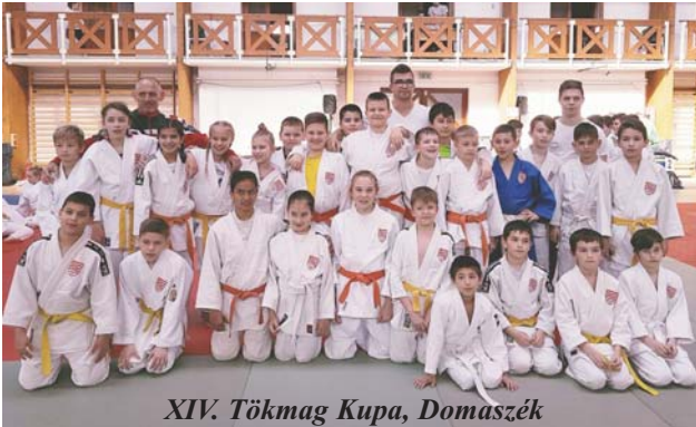
XIV. Tökmag Kupa, Domaszék

A régió legnagyobb utánpótlásversenye a Budapest Kupa, melyet idén 30. alkalommal rendezték meg.