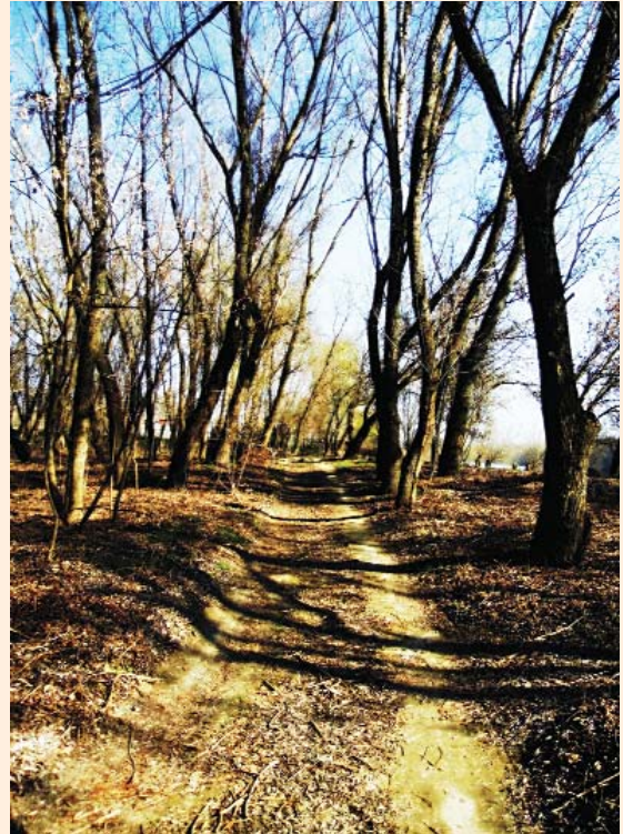
Párhuzam az őszben