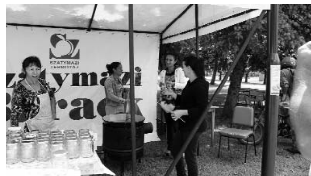
Két napig kavarták