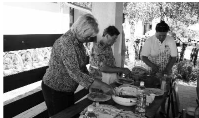
Rendületlenül készül a palacsinta