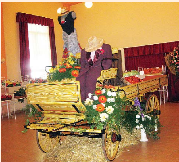
Részlet a falunapi virágkompozícióból