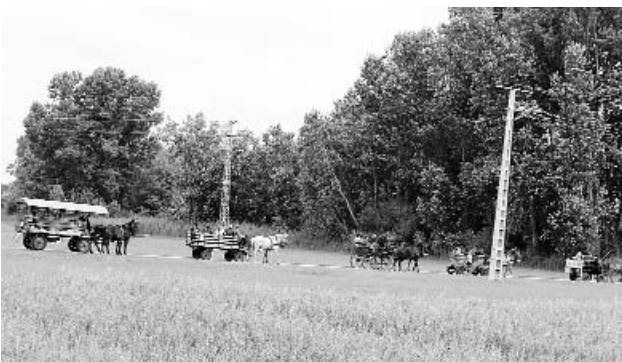
Vonulnak a fogatosok