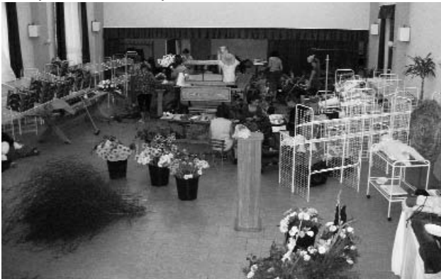
Készül a nagyterem