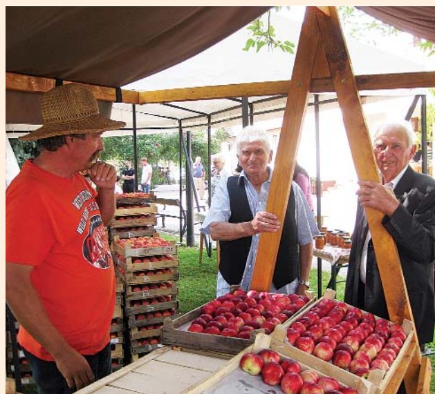
Termelők egymás közt a falunapon