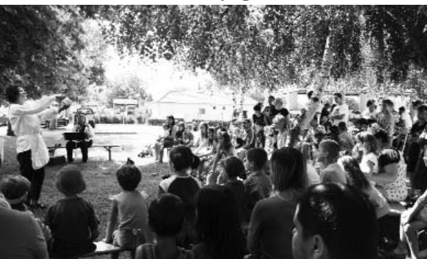
Bábelóadás a fák között