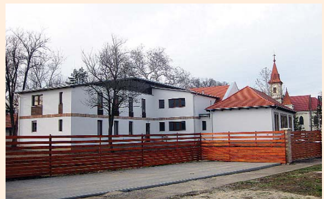
Elkészültek a Rehabilitációs központ munkálatai

A szerkesztőség fenntartja magának a jogot, hogy a beküldött írásokat rövidítve, illetve szerkesztve közölje. Az újság az olvasók fóruma, a közölt levelek, cikkek tartalmával a szerkesztőség nem feltétlenül ért egyet.