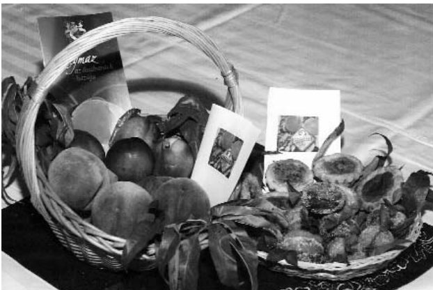
Szezonális étek díja nyertes remekműve

zőversenyen arattak sikert és szerzett dicsőséget Szatymaznak a Fakanál klub. 25 kilogramm főtt csülök és 60 óriás palacsinta 40 embert tett elégedetté és boldoggá aznapra. Gratulálunk!