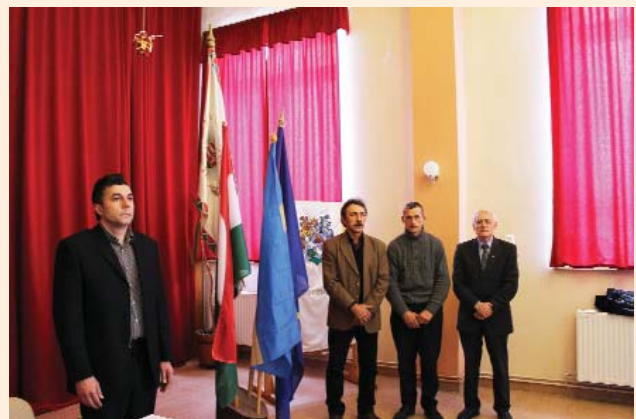
Székely zászló átadása (Cikk a 6. oldalon)