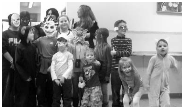
Kedves emlék - Batyubál 2012

netet mondani minden támogatásért! Szeretnénk külön megköszönni Bakosné Icu rendszeres segítségét!