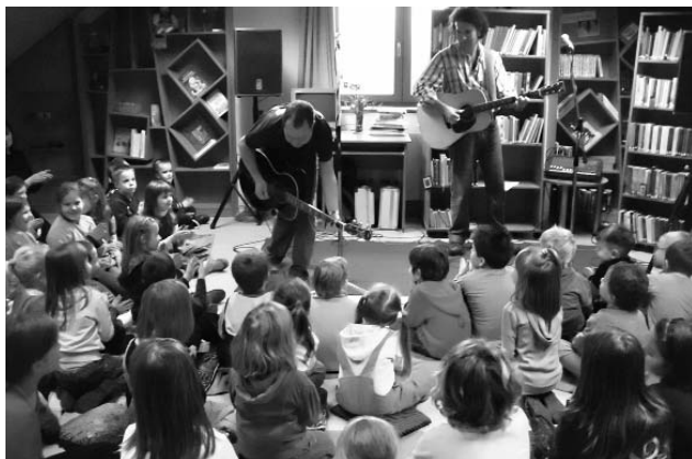
Ajándék koncert a „kis könyvmolyoknak” a Péter&Pán gitárduóval.