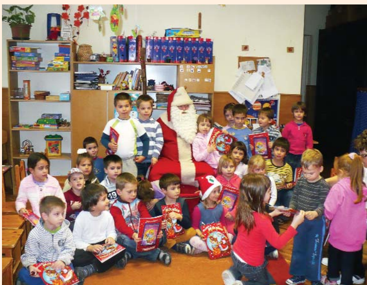
Óvoda: Mikulás a Katica csoportban

A szerkesztőség fenntartja magának a jogot, hogy a beküldött írásokat rövidítve, illetve szerkesztve közölje. Az újság az olvasók fóruma, a közölt levelek, cikkek tartalmával a szerkesztőség nem feltétlenül ért egyet.