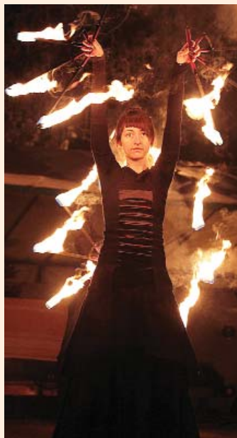
Kultúrparki advent: Flame Flowers tűzszonglőrök