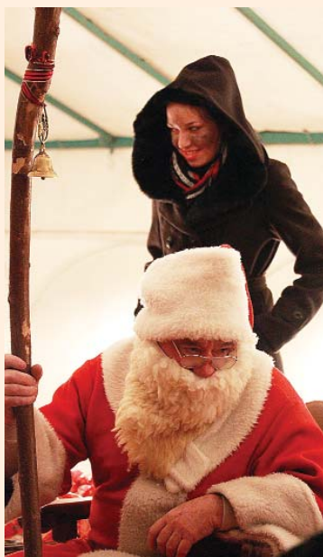
A Kultúrparki adventen is megajándékozta a gyermekeket a mikulás