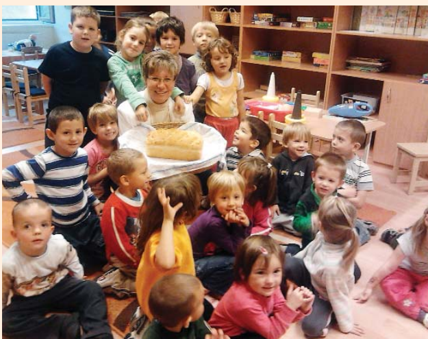
Kenyérsütés a Mókus csoportban