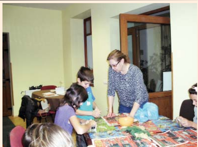
Foglalkozás a Napközis Táborban

A szerkesztőség fenntartja magának a jogot, hogy a beküldött írásokat rövidítve, illetve szerkesztve közölje. Az újság az olvasók fóruma, a közölt levelek, cikkek tartalmával a szerkesztőség nem feltétlenül ért egyet.