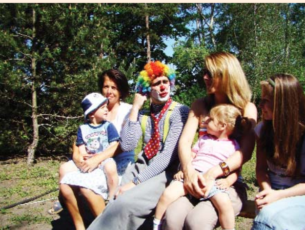
Bohóc műsor a Majálison