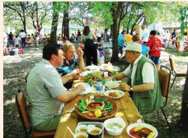
Munkában a zsűri

A szerkesztőség fenntartja magának a jogot, hogy a beküldött írásokat rövidítve, illetve szerkesztve közölje. Az újság az olvasók fóruma, a közölt levelek, cikkek tartalmával a szerkesztőség nem feltétlenül ért egyet.