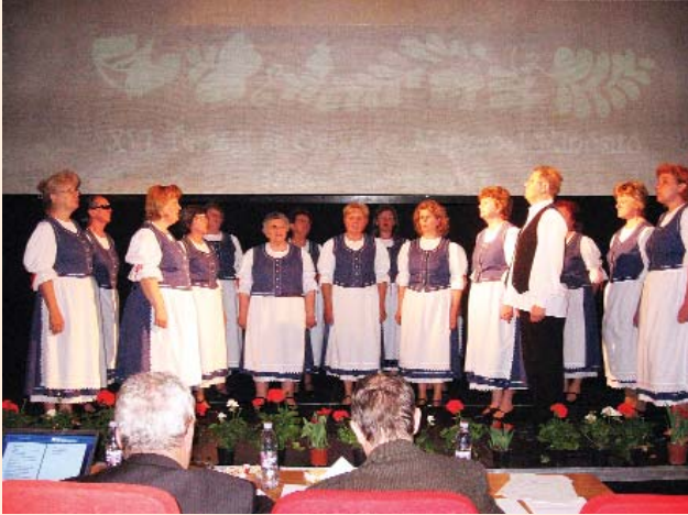
A négyszeres ARANY PÁVA díjas kórus

Amennyiben szeretnék, hogy újszülöttjük fotója megjelenjen a "Mi Lapunkban", kérjük, az adatokat küldjék el e-mailben a milapunk@szatymaz.hu címre, vagy személyesen hozzák el a szerkesztőségre.