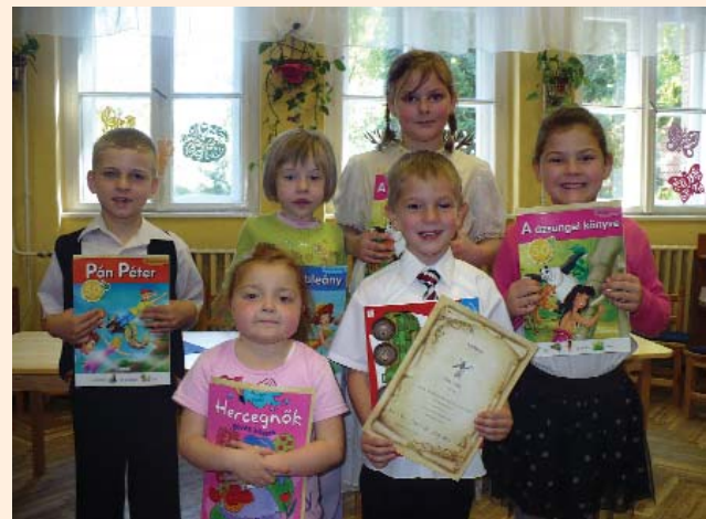
A szatymazi csapat