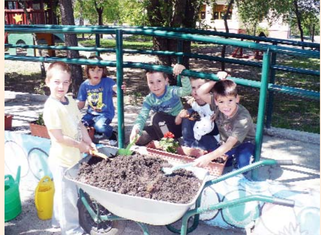
Virágosítás az óvodában