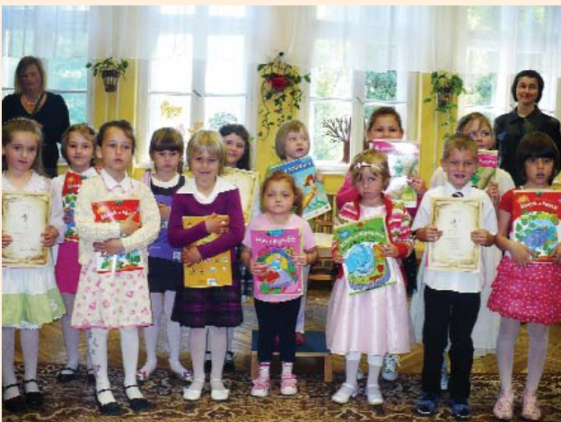
Dalospacsirta találkozó résztvevői