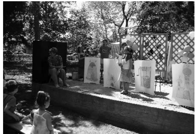
A Kiskakas gyémánt félkrajcárja dramatikus játék