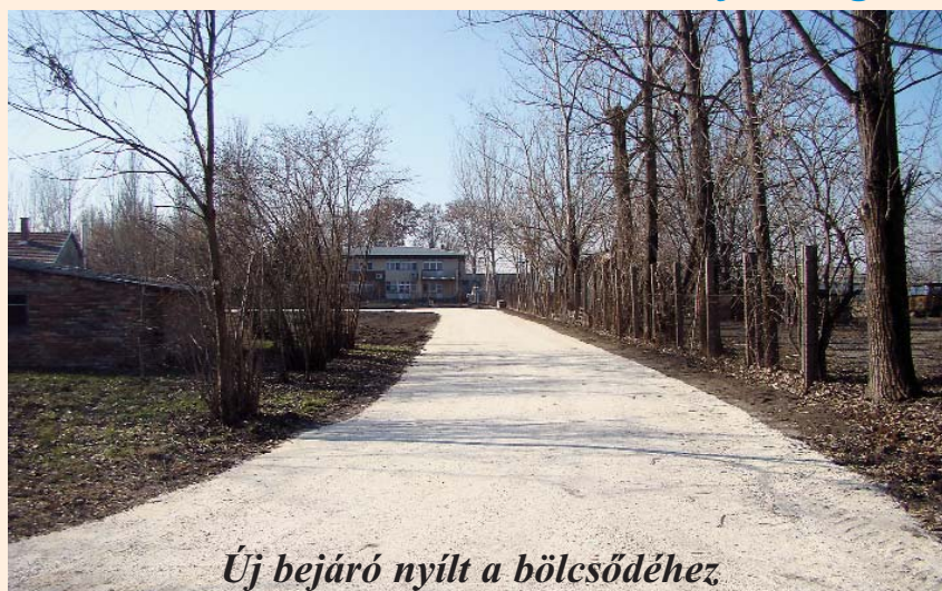
Új bejáró nyílt a bölcsődéhez