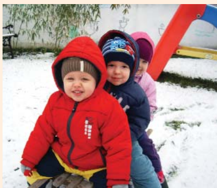
Akik örülnek a hónapnak