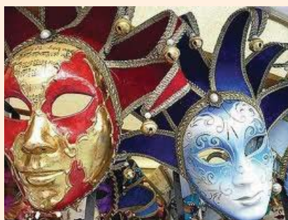
Indul a farsang

Jön a tavasz, megy a tél, barna medve üldögél: -Kibújás, vagy bebújás? Ez a gondom óriás!