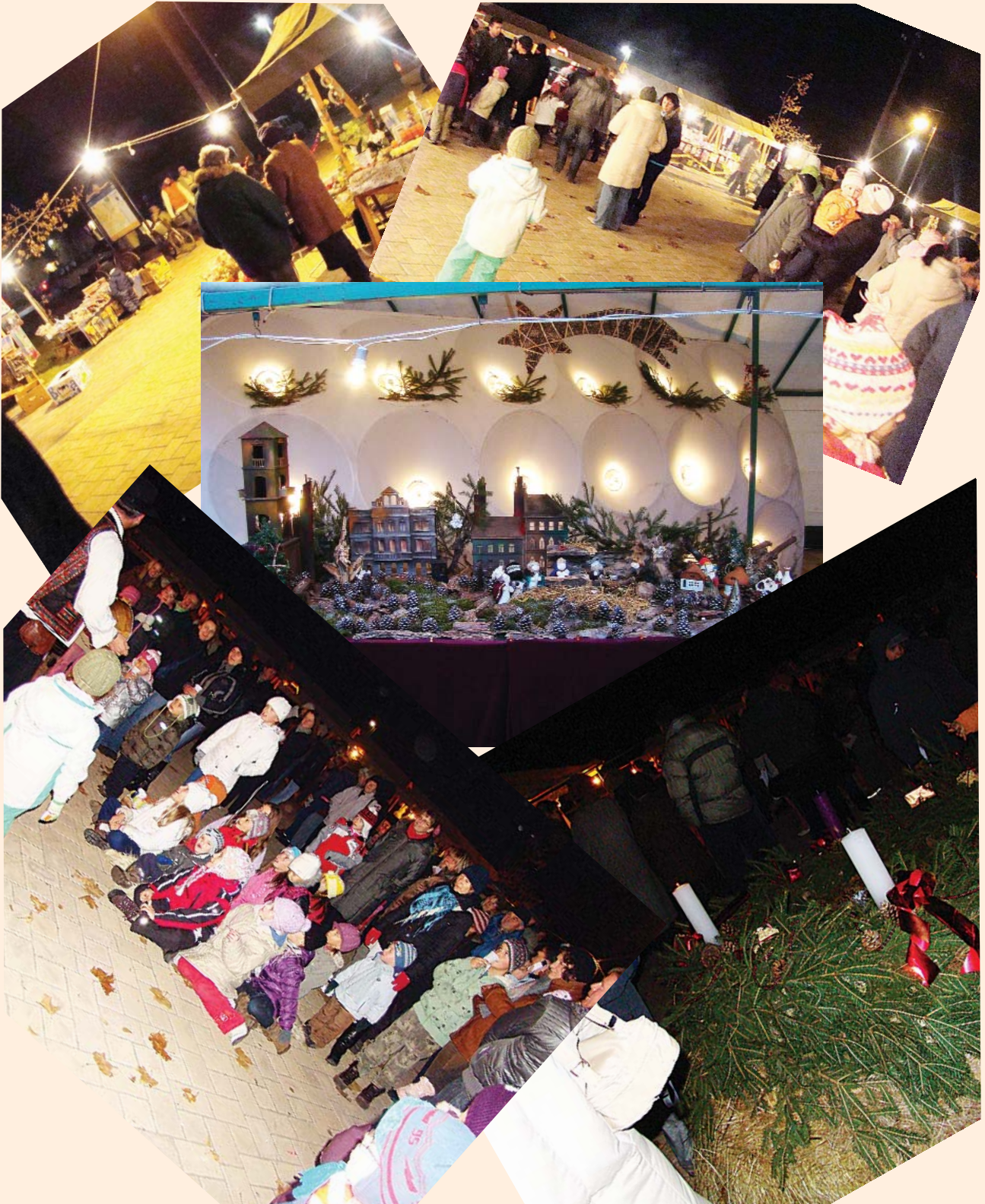
Adventi pillanatok a Kultúrparkból