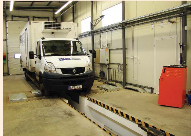
És az eredmény