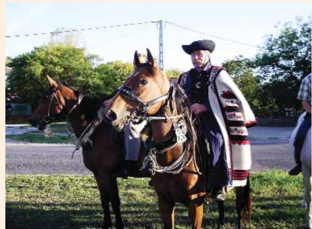
Lovas csapat a dobogón