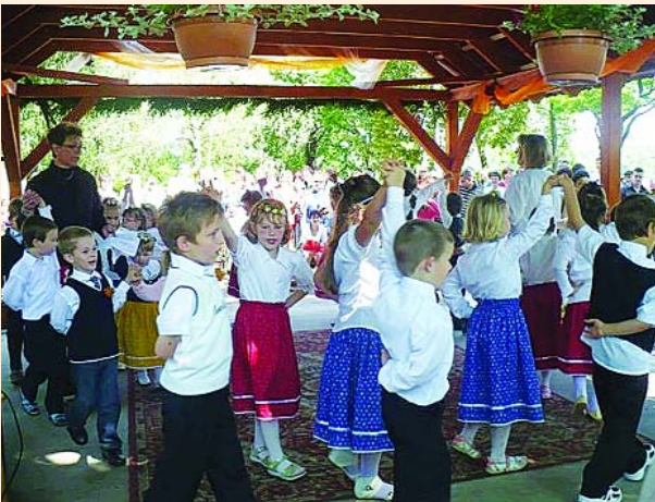
Ovodai évváró ünnepség