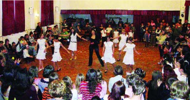
(a felső tagozatosok farsangjáról márciusi lapunkban olvashatnak)