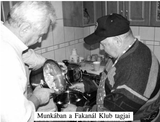
Munkában a Fakanál Klub tagjai

A Nyugdíjas Egyesület következő összejövetelét február 25-én (szerda) 17 órakor tartja a művelődési házban.