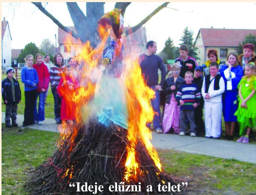
“Ideje elűzni a telet”

"Mit írjak a farsagról? A farsagról, amely már nincs? Az én ifjúságomban még volt. A különbség a tegnap és ma között annyi, hogy ti maiak farsangban is táncoltok, mi tegnapiak pedig csak farsangban jártuk. Az élvezet, amit mi tegnapiak néhány rövid farsangi hétbe szorítottunk bele, azt ti maiak felapróztátok és szétosztottátok egy egész esztendőre. Ti többet mulattok, de mi jobban mulattunk."