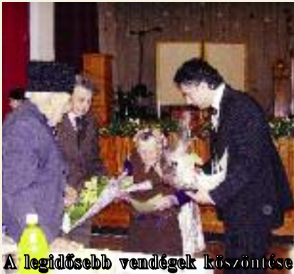
A legidősebb vendégek köszöntése