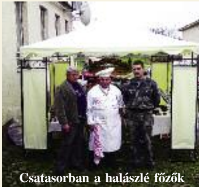
Csatasorban a halászlé főzők