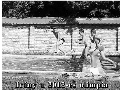
Irány a 2012-es olimpia