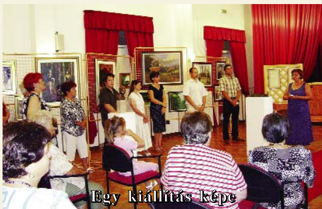
Egy kiállítás képe

A fotó augusztus 13-án készült a településünkön élő és innen elszármazott művészek kiállításának megnyitóján. Kilenc Szatymazhoz kötődő alkotó munkáiban gyönyörködhetek a látogatók.