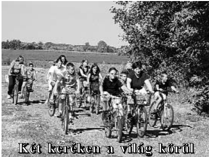
Két keréken a világ körül