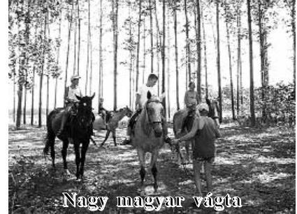
Nagy magyar vágta

A nyári szünetben 16 rászoruló kisgyereknek nyári tábort szerveztünk, melyhez az anyagi támogatást egy a szabadidő hasznos eltöltésére kiírt kistérségi pályázaton nyertük. Augusztus 11. és 17. között változatos programokon vehettek részt a gyerekek pedagógusaink szervezésében és kíséretével. A résztvevők az étkezést is kedvezményesen kapták.