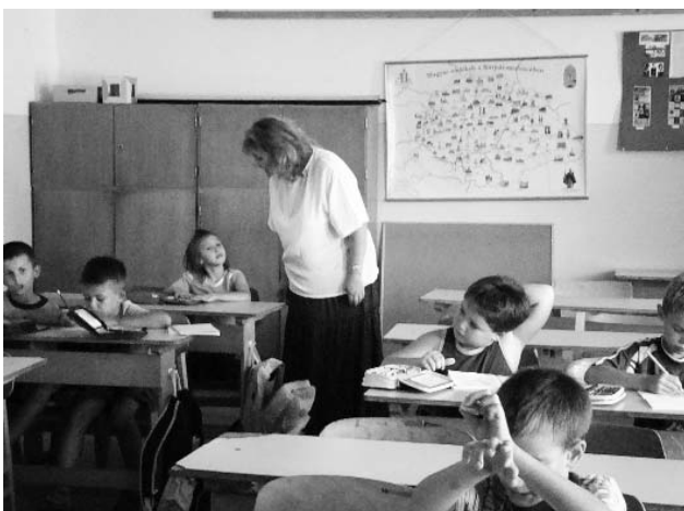
Hogy is van ez?