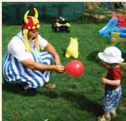
“Obelix a Mesevárban”