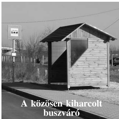
A közösen kiharcolt buszváró

A településeken belüli összefogás kulcskérdés lehet egy község életében: ha mindenki tolja a közös szekeket még az akadályok sem tornyosulnak olyan magasan előttünk. Ezen túlmenően egyre hangsúlyosabb a pályázati rendszerben is a települések összefogása, mint vezérelv. A jövőben erre kiemelt figyelmet kell fordítanunk. Vannak azonban a szomszédos községek viszonylatában olyan, a mindennapi élettel kapcsolatos feladatok, amelyek vagy nem is számíthatnak pályázati forrásra, vagy egyéb módon is megoldhatók. Az előbbi tendőkre jó példa a Szatymaz- Zsombói határút karbantartása. Az út teljes hosszában Zsombó tulajdona, mivel azonban legalább annyi szatymazi lakos is használja, mint zsombói, teljesen logikus, hogy az útjavításból mindkét falu kivegye a részét. Tavaly leültünk egymással és megállapodtunk róla, hogy az autópálya felüljárójától Forráskút irányába Zsombó; Dorozsma irányába pedig Szatymaz fogja végezni a jövőben ezt a munkát.