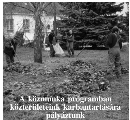
A közmunka programban közterületeink karbantartására pályáztunk