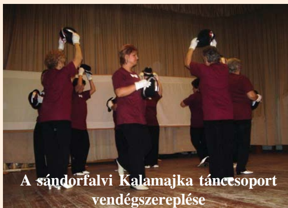
A sándorfalvi Kalamajka táncsoport vendégszereplése