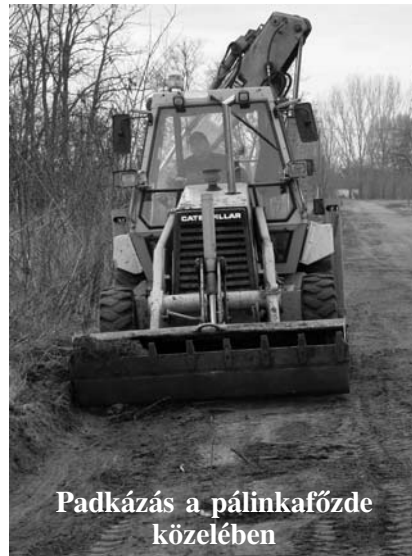
Padkázás a pálinkafőzde közelében