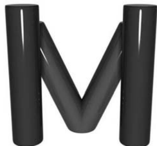
Mesevár Családi Naphőzi Szatymaz

Január már elszállt, még is meszsze még a nyár. Sokan várjuk már a meleget, akár csak a gyerekek. A sok ruha, a kabát, a sapka, a sál az egész nap csak öltözködésből áll. Bezzeg a nyáron, süttött a nap száz ágon. Nehéz elűzni a hideget, de legalább a szívünkbe hozzunk egy kis me-