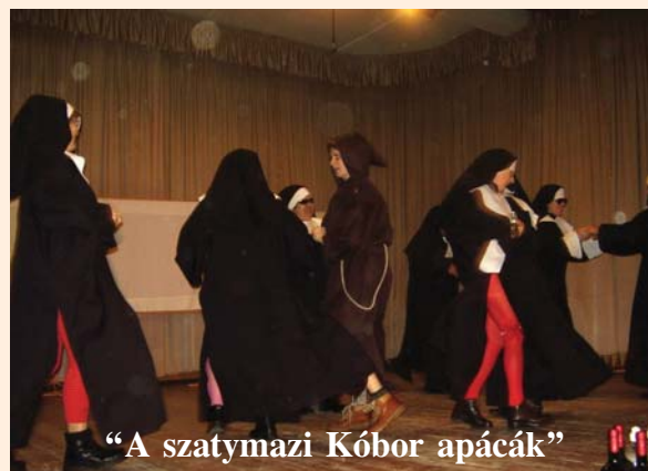
“A szatymazi Kóbor apácák”