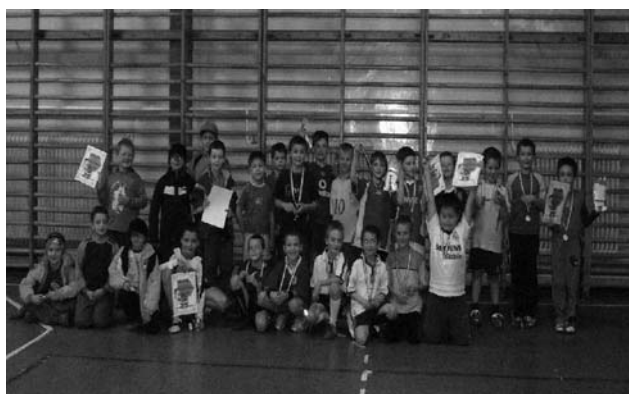
A Mikulás kupa résztvevői (2007 december)