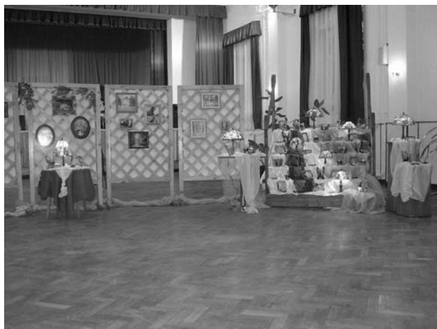
Karácsonyi kiállítás és vásár