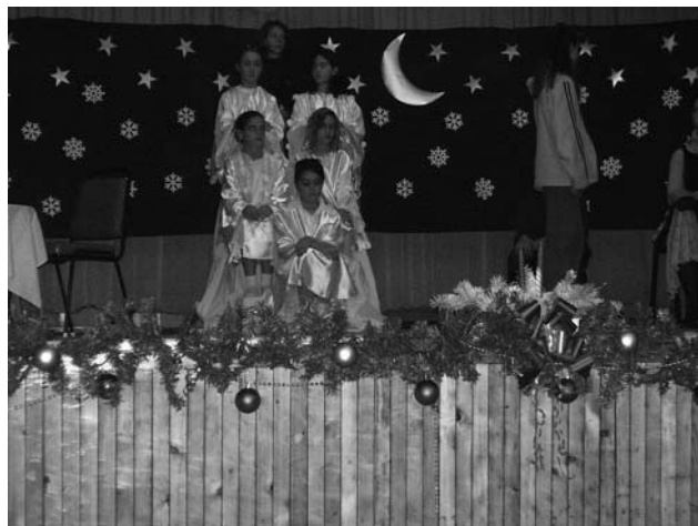
Felsősök ünnepi műsora