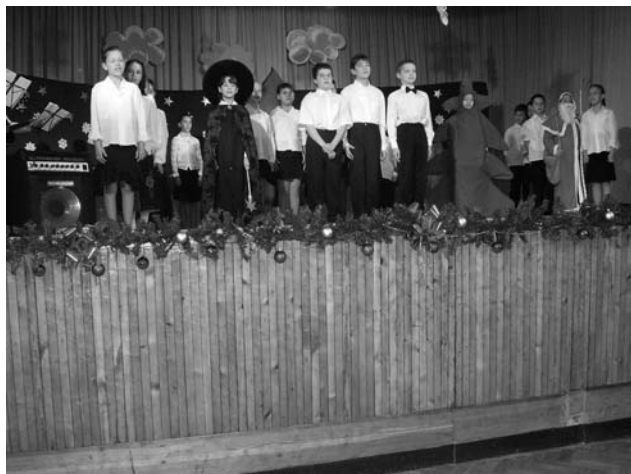
Alsósok műsora az idősök karácsonyán