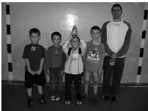
A győztes csapat (2007 tavasz)