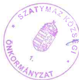
Barna Károly polgármester